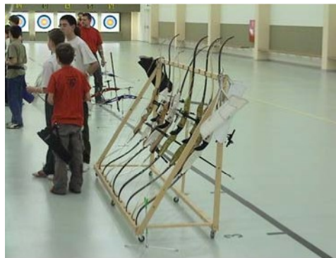
Közös mozgatható állvány az íjaknak.

Ha egy-egy feladat erejéig a megszokottnál rövidebb távon lövünk, akkor letehetjük az íjakat a földre is, 3 méterrel a lövonal mögött. Amikor visszatérünk a megszokott lőtávolsághoz, az íjakat ismét az állványokra, vagy a várakozó vonal mögött a földre helyezzük.