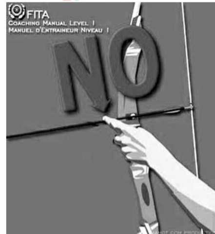
Az ujjak erős nyomásától megsérülhet a vessző