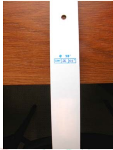
A reflex technikai sajátosságai/adatai az alsó kar belső oldalán található

A tanítványnak pontosan meg kell tanulnia az edzőtől, hogy hogyan kell össze- és szétszerelni az íjat (ha az íj szétszedhető). Egy leajzott reflex íj karjai a tábla irányába mutatnak. Egy korábbi FITA szabálynak megfelelően a legtöbb íjon a felső reflex belső oldala (ami az íjász felé néz) üres, míg a reflex adatait (hosszúság és húzóerő) az alsó rész belső felén tüntették fel (ahogy azt a jobboldali ábra mutatja.).